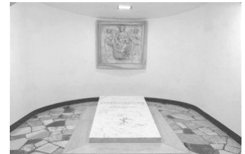
Tombe de Jean-Paul II

En ce qui concerne les funérailles, je donne les mêmes dispositions que celles déjà données par le Pape Paul VI. (Note en marge: la sépulture en terre et non dans un sarcophage 13.3.92).