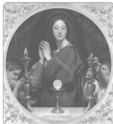
Marie, "femme eucharistique"

Le mois de mai donne une couleur mariale à notre Journée. Marie est la "femme eucharistique", celle qui nous a donné Jésus, le Pain de Vie. Elle nous donne encore chaque jour le Pain de route, car notre Mère du ciel continue de nous accompagner avec son Fils sur nos chemins de foi, contrastés d'ombres et de lumière. Elle nous aide à avancer dans l'amour, grâce au rayonnement eucharistique, pour parvenir à la sainteté chrétienne.