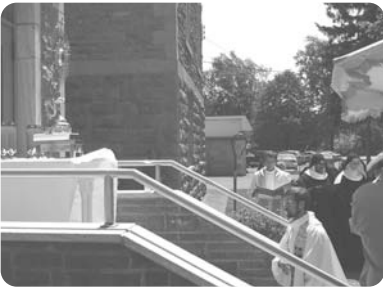
Le Reposoir de la Fête-Dieu devant le monastère

Le pape annonce, si possible, un second volume traitant des évangiles de l'Enfance de Jésus, de la Passion et de la Résurrection. Prions Dieu de soutenir et de protéger notre Saint-Père.