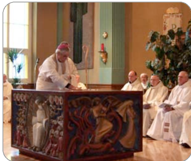
L'évêque oint l'autel