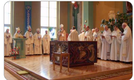
Mgr Lussier au milieu des concélébrants

L'église abbatiale et son autel sont consacrés au Seigneur sous l'invocation de NOTRE-DAME-DE-LA-PAIX, titulaire de l'abbaye.