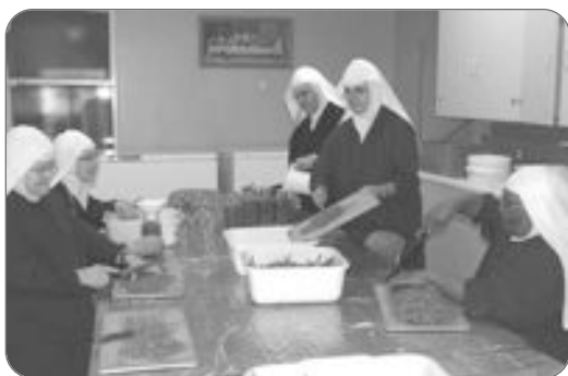
Merci au Seigneur pour ma famille, ma communauté, mon travail.

Chacun(e) adaptera sa prière à la situation concrète de sa vie. Pour quelques-un(e)s, ce sera la découverte de grâces spéciales apportées par un état de santé déficient, l'avancée en âge, la solitude, la perte d'un emploi ou de proches... Dieu est toujours présent au cœur de nos vies. Il nous accompagne jusqu'au terme de notre route, aussi bien aux jours de peine qu'aux jours de joie. En nous appuyant sur lui, la flamme de l'espérance peut se maintenir dans nos cœurs : quels que soient les événements, la foi en Dieu nous apporte paix et sérénité.