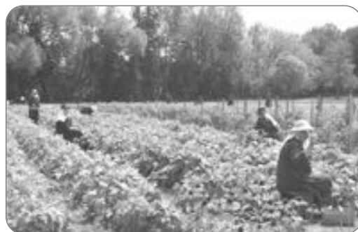
Merci à Dieu pour la nature et pour le beau temps durant les récoltes de fèves.

Notre reconnaissance s'étend aussi à tous les biens dont le Seigneur est la source et qui nous permettent de vivre notre vie de tous les jours en famille, en société et en Église.