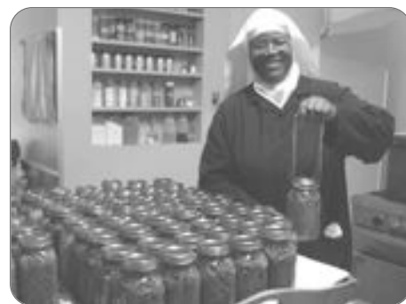
Merci à Dieu pour les aliments qui soutiennent ma vie et ma santé.

"Je profite de la fête de l'Action de grâce pour remercier le Seigneur pour les trésors de ma vie : la santé, les amis, la nature, la famille, ma communauté..."