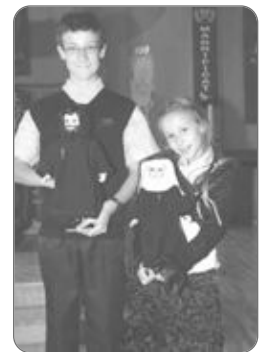
Éveiller la vocation chez les jeunes

Le Saint-Père a enfin souhaité qu'en cette Année sacerdotale, « les familles chrétiennes deviennent de petites Églises, où toutes les vocations et tous les charismes donnés par l'Esprit Saint puissent être accueillis et valorisés. »