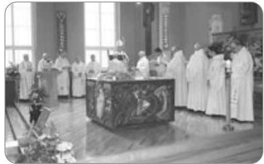
Notre évêque et les prêtres concélébrants

Cette année jubilaire ne manquera pas d'apporter un renouveau pour les prêtres eux-mêmes, pour la dignité de leur prêtrise et l'approfondissement de leur mission.