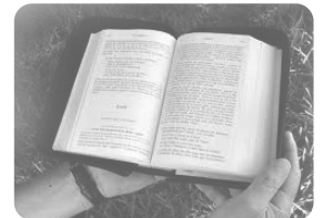
Un instrument pour soutenir la foi

Ici, en effet, émerge la richesse d'enseignement que l'Église a accueilli, gardé et offert au cours de ses deux mille ans d'histoire. De la sainte Écriture aux Pères de l'Église, des Maîtres de théologie aux Saints qui ont traversé les siècles, le Catéchisme offre une mémoire permanente des nombreuses façons dans lesquelles l'Église a médité sur la foi et produit un progrès dans la doctrine pour donner certitude aux croyants dans leur vie de foi.