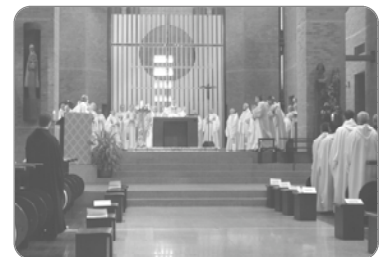
Eucharistie dans l'église de St-Benoît-du-Lac

Les repas du midi et du soir, grâce à une permission spéciale obtenue par le Père Abbé, sont pris par tous au réfectoire des moines, en récréation.