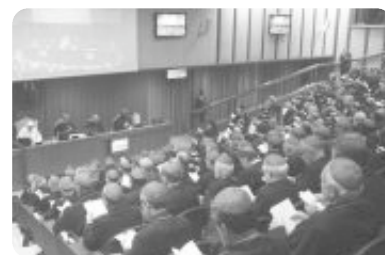
Au Vatican, 7 - 28 octobre 2012

Dans les temps actuels marqués par d'incessants changements, l'annonce de Jésus Christ nécessite une nouvelle approche des personnes et de la société. C'est pourquoi le prochain Synode des évêques se penchera sur la nouvelle évangélisation et la transmission de la foi. Il s'agit d'une priorité pour l'Église, dans le but de remplir la mission confiée par le Christ d'évangéliser toutes les nations, non seulement les pays lointains, mais notre propre milieu sécularisé. (Cf. document ci-joint)