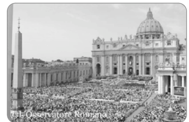
À Saint-Pierre de Rome le 11 octobre 2012

Qu'est-ce que la foi ? La foi, c'est notre relation à Dieu, c'est reconnaître que Dieu est notre Créateur et notre Père, c'est une rencontre avec Jésus Christ, dans l'Esprit Saint. Par la foi, nous adhérons aux vérités révélées, lesquelles nous ont été transmises dans l'Église par les générations précédentes, et sont résumées dans le Credo. Pour croire en Dieu, il faut premièrement le connaître. Cette connaissance s'acquiert non seulement par l'étude, mais aussi par l'amour, par l'Esprit Saint qui nous donne l'expérience spirituelle d'un contact avec Dieu, approfondi dans la prière et la contemplation. Redisons souvent le Symbole de Nicée-Constantinople: c'est la prière officielle de l'Année de la foi.