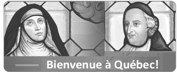
Saint François de Laval et sainte Marie de l'Incarnation

Le 3 avril dernier, deux autres bienheureux ont été canonisés: Mgr François Montmorency de Laval, premier évêque canadien, et Marie de l'Incarnation, fondatrice du couvent des Ursulines à Québec. Ces deux missionnaires d'origine française pleins de foi et de piété ont été pionniers de l'évangélisation en Amérique du Nord, et ils sont considérés comme le "père et la mère" de l'Église canadienne.